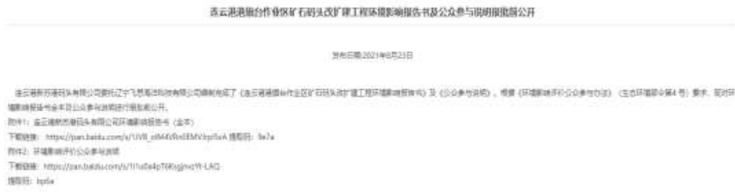
图 5-1 报批前信息公开截图