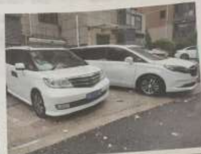
两辆汽车被砸伤,物业公司已积极采取措施应对处置。

“会合线”“掉皮”“裂开”……7月27日晨五时,一向喜笑颜开的三禾·城中城小区的业主们,突然发现小区中城中心,发生了两起严重事故,导致两辆汽车被砸伤。事故原因正在调查,但业主们已经感到不安。物业公司表示,已积极采取措施应对处置。