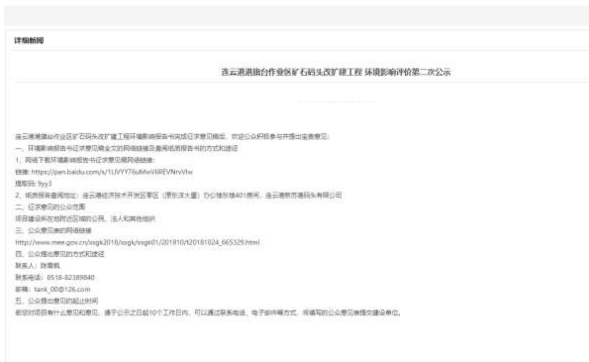
图 3.2-1 征求意见稿网络公开情况图